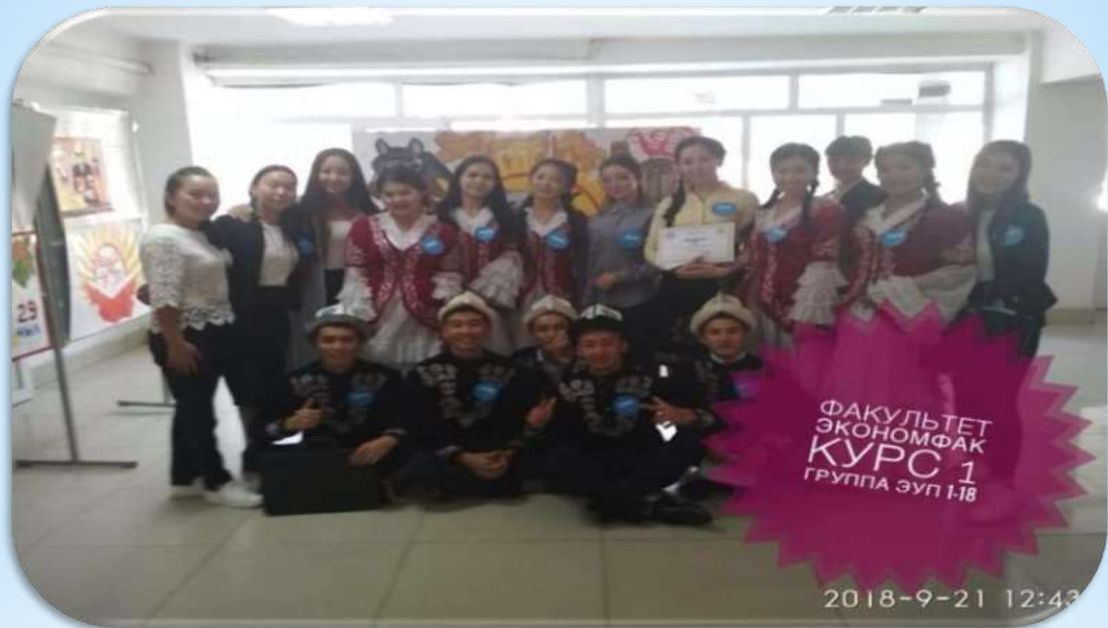
ЭУП-1-18 тайпасы «23-сентябрь Кыргыз тили майрамын майромдоодо»