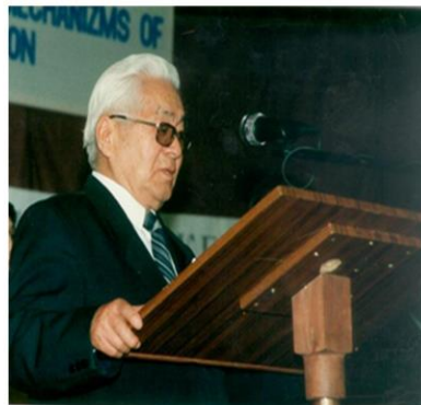
Т. У. Усулбаев открывает Мирные игры на тему: «Военные ресурсы Кыргызстана и механизмы предотвращения региональных конфликтов»