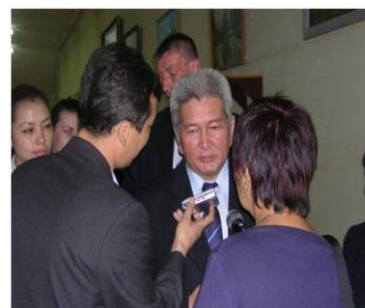
Лидер партии «Ар Намыс» Феликс Кулов на студенческих дебатах ФМО «Президентские выборы в Кыргызстане и стратегия обеспечения демократических выборов»