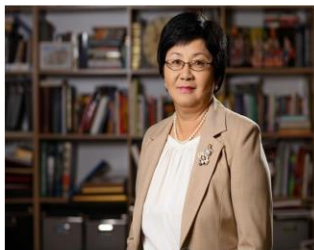
Экс-Президент КР Реса Отунбаева - гость факультета

предлагает программу обучения, предназначенную обеспечить студентов теоретическими и практическими знаниями для глубокого осознания источников и мощи мировой политики 21 века