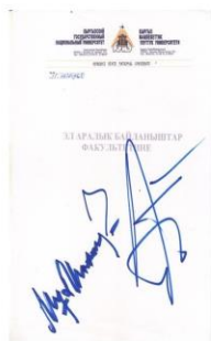
У истоков создания нашего факультета нас благославили Чингиз Алтамынов и Мухтар Шаханов - почтительные исторический подарок будущим дипломатам, главный подарок ФМО от великого писателя и дипломата Кыргызстана Чингиза Торкуловича Алтамынова